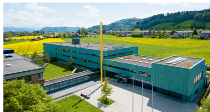
Eidgenössisches Institut für Metrologie METAS Lindenweg 50, 3003 Bern-Wabern, Schweiz Telefon +41 58 387 01 11, www.metas.ch

In der Schweiz sind die kantonalen Eichämter (Fachstellen für das Messwesen) für die Eichung und die Überwachung von Waagen, Tanksäulen (für Benzin, Diesel, Flüssiggaskraftstoffe und AdBlue) und Tanklastwagen, Raum- und Längenmassen sowie von Abgasmessmitteln zuständig. Die Eichämter stehen Ihnen für die Beantwortung von Fragen zur Verfügung. Das in Ihrem Gebiet zuständige Eichamt und seine Adressen finden Sie in einem Verzeichnis auf dem Internetauftritt des METAS ( www.metas.ch/eichen ).